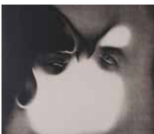
ALBERTO MARTINI Il Bacio, 1915 Oderzo, Fondazione Oderzo Cultura

Prima dell'affondo dedicato a Poe, esperienza che Martini avvia nel 1905, il percorso espositivo indugia su altre produzioni dei decenni a seguire, fondamentali per accennare alle eterogenee sfumature creative multidisciplinari affrontate dall'artista . Pittore di vaglia, sostenitore dell'arte totale - cresciuto nello spirito della multidisciplinarietà creativa dell'Art Nouveau - creatore di visioni oniriche, Martini dà prova di sé negli splendidi oli simbolisti destinati ad essere esposti nella cosiddetta "Sala del Sogno" alla 7. Esposizione Internazionale d'Arte di Venezia del 1907 .