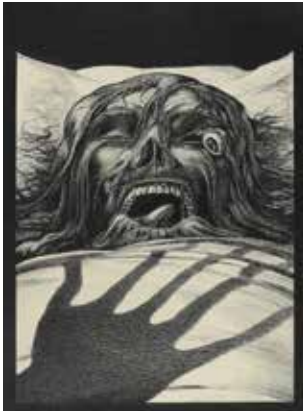
ALBERTO MARTINI La vérité sur le cas de M. Valdemar, 1907 Verona, Biblioteca Civica