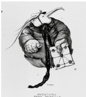
ALBERTO MARTINI Adventure sans pareille d'un certain Hans Pfaall, 1905 Oderzo, Fondazione Oderzo Cultura