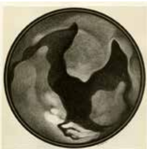
ALBERTO MARTINI La Genèse d'un poème (Le corbeau) , 1906 Milano, Collezione privata

La maestria del segno raggiunta da Martini si mostra ineguagliabile. La fantasia creativa nella resa dei personaggi e nella definizione della atmosfere appare assolutamente originale anche se Martini coglie ovunque gli sia possibile - mostre, pubblicazioni, pubblicità, calchi medianici - spunti e suggestioni per dare vita a un universo che ha pervaso l'immaginario di intere generazioni: La discesa nel Maelstrom, Valdemar, il Re peste, Lionnerie, L'uomo della folla, il Corvo, Hop Frog, Hans Pfaall, La maschera della morte rossa o il Gatto nero.