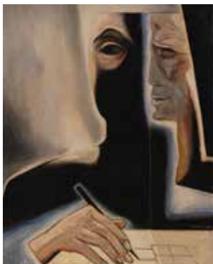
ALBERTO MARTINI L'esprit travaille, 1929 Treviso, Musei Civici - Museo Bailo

quello stesso anno è l'ultimo autoritratto in mostra, il suo testamento spirituale La finestra di Psiche nella casa del poeta ), straordinario portavoce delle più oscure urgenze e delle tensioni esistenziali della prima metà del Novecento.