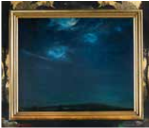
ALBERTO MARTINI Nel sonno, 1906-1907 Milano, GAM