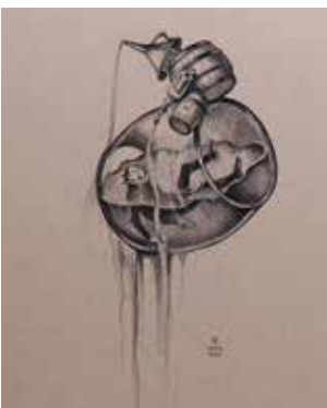
ALBERTO MARTINI L'ange su bizzarre , 1908 Milano, Collezione privata

L'incontro tra Martini e Poe era dunque solo questione di tempo. La scrittura di Poe illumina improvvisamente gli spazi dell'immaginazione martiniana arricchendola di nuove, allucinate visioni: scheletri, mostri, personaggi terrificanti. Grottesco e lugubre si rincorrono e Martini crea un linguaggio totalmente nuovo ponendosi in un dialogo ideale con Poe. Entrambi analizzano il dettaglio fino allo sfinimento per rivelarne significati reconditi; entrambi amano l'oscurità che sentono animata di demoni e fantasmi; entrambi aprono la strada all'inconscio e al doppio.