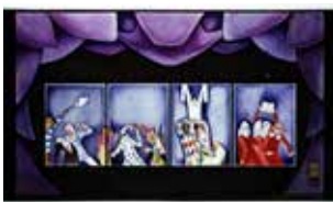
ALBERTO MARTINI Cuore di cera - Panopticum, 1919/20 Milano, Collezione privata