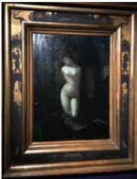
ALBERTO MARTINI Diavolessa, 1930 Milano, Collezione privata